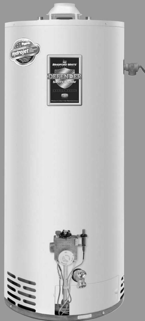
Photo du M-I-40T6FBN